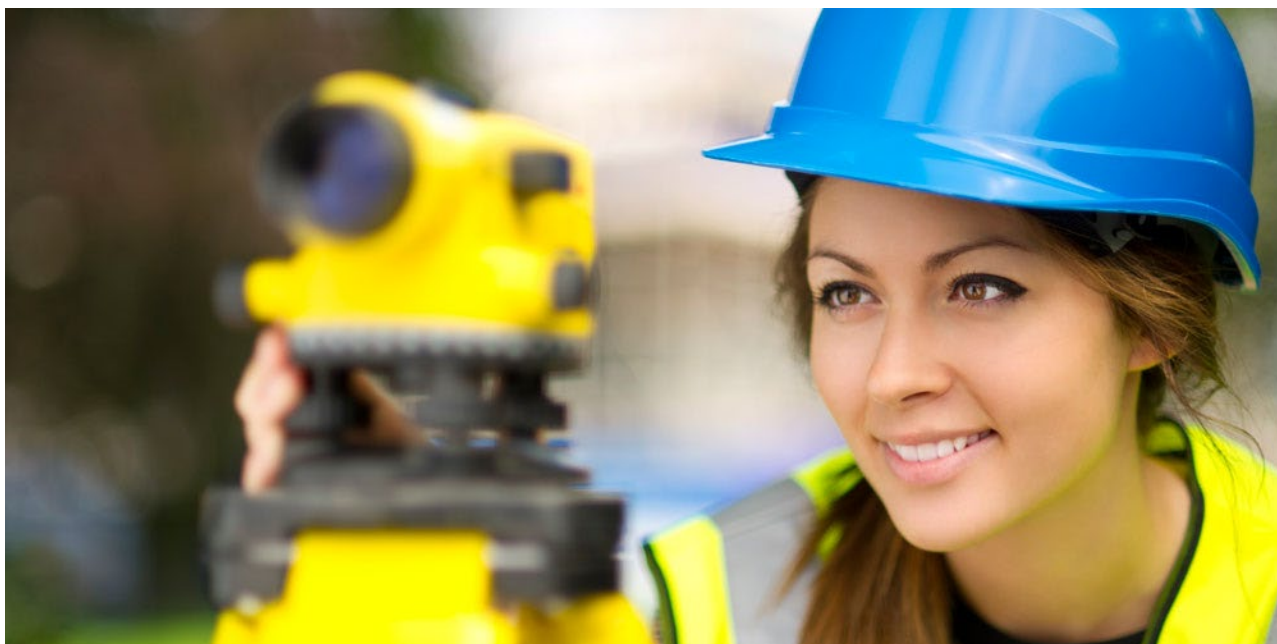
Abbildung 1: Quellenangabe